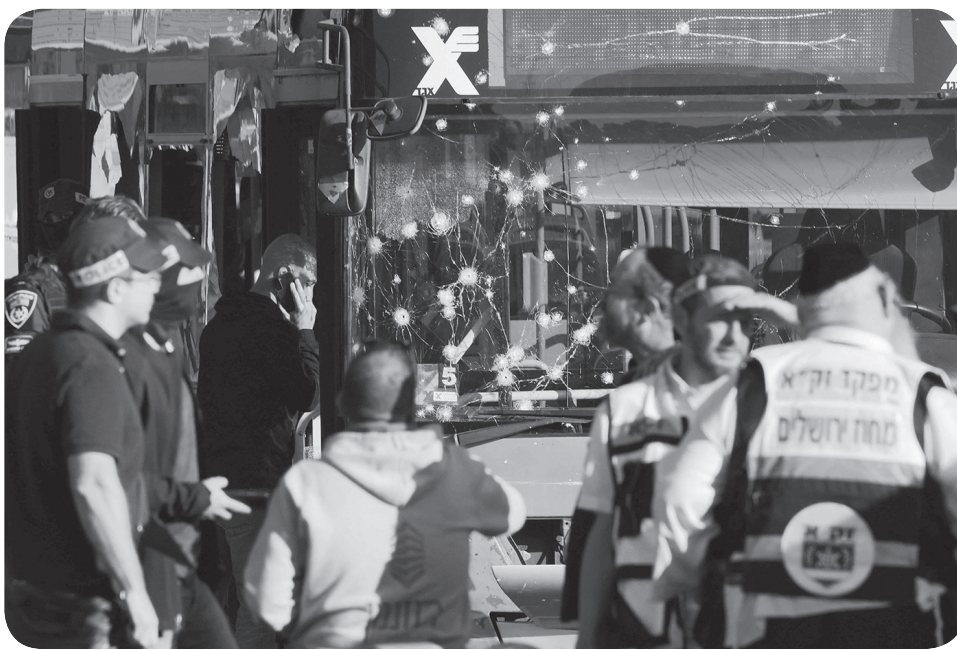
DUA LEDAKAN MENGHANTAM YERUSALEM

Pengayaan uranium hingga kemurnian 60 persen merupakan langkah teknis singkat dari tingkat senjata, yakni sebesar 90 persen. Sejumlah pakar nonproliferasi telah memperingatkan dalam beberapa bulan terakhir bahwa Iran memiliki cukup uranium yang diperkaya 60 persen untuk diproses ulang menjadi bahan bakar untuk setidaknya satu bom nuklir. Iran telah berulang kali membantah anggapan bahwa mereka memiliki ambisi untuk membuat bom atau senjata nuklir. ● ans